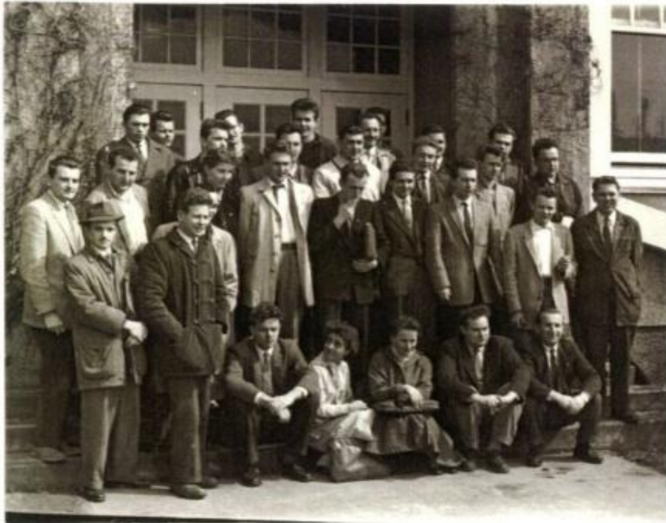
Ötödévünkévünk, '58-59 telén